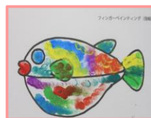
フィンガーペインティング (指絵)