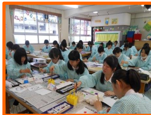
さまざまな技法を教えていただきました。