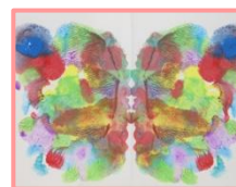
テカルコマニー (合わせ絵)