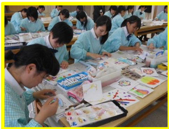
小さい子は筆を使うのが難しいので、指で色を塗ることが分かりました。