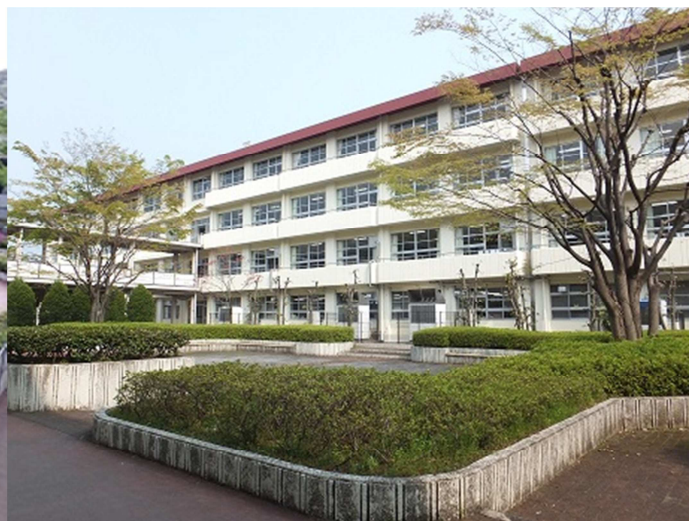
中庭（文化祭でコンサートなどができる野外ステージがあります）