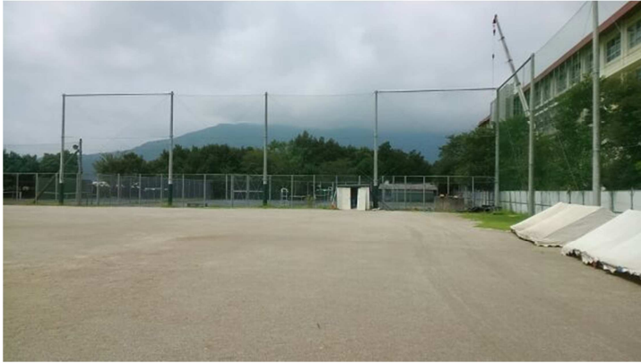
グラウンド (奥に第2テニスコート)