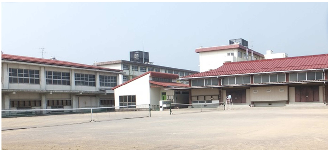
広いテニスコート（正面）、体育館（左：改修される予定です！）、錬心館（＝格技場）（右）