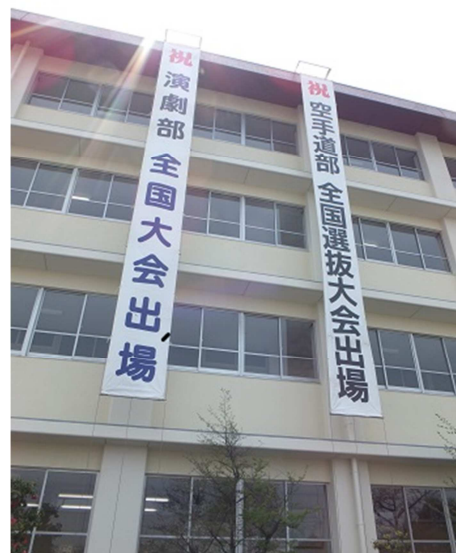
部活動の応援垂れ幕