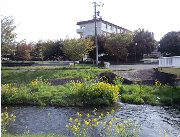
池高の西を流れる東川…菜の花が満開です（4月）。