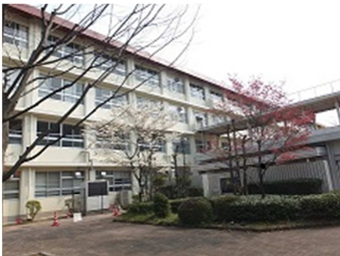
中庭の紅白のハナミズキがきれいです（5月）。