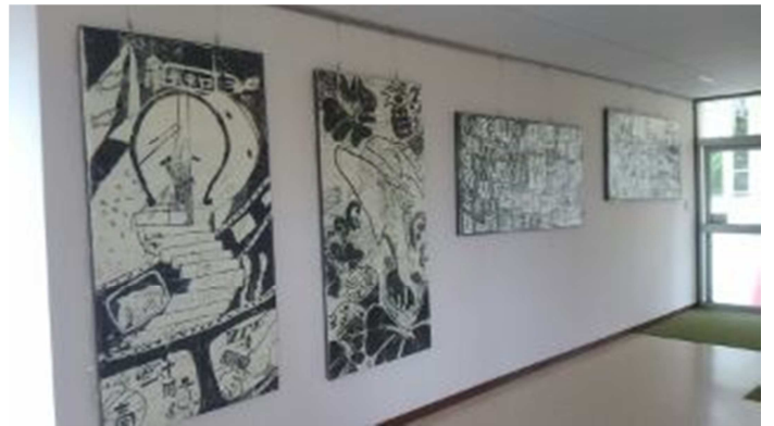
校舎のあちこちに版画大会で制作した作品が並びます。