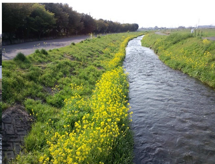
秋には蛍が見られる美しい川です。