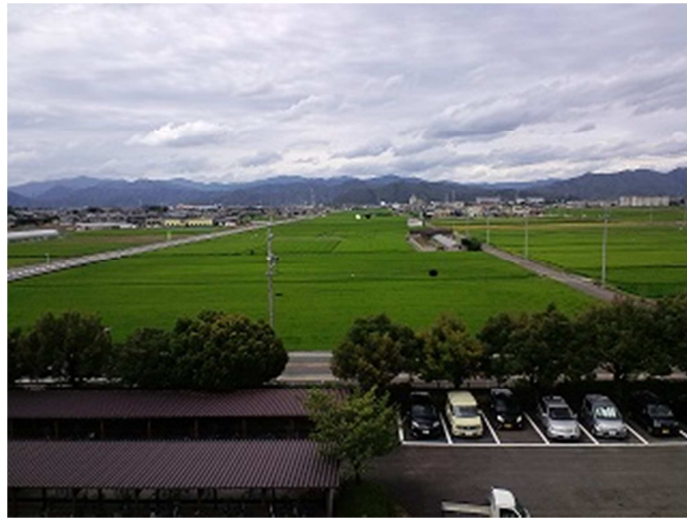
本館棟4階から美しい池田の水田が見渡せます（7月）。