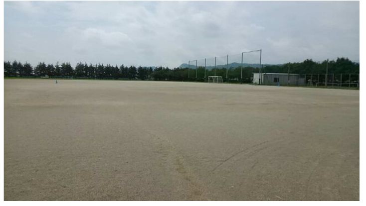
サッカーグラウンド