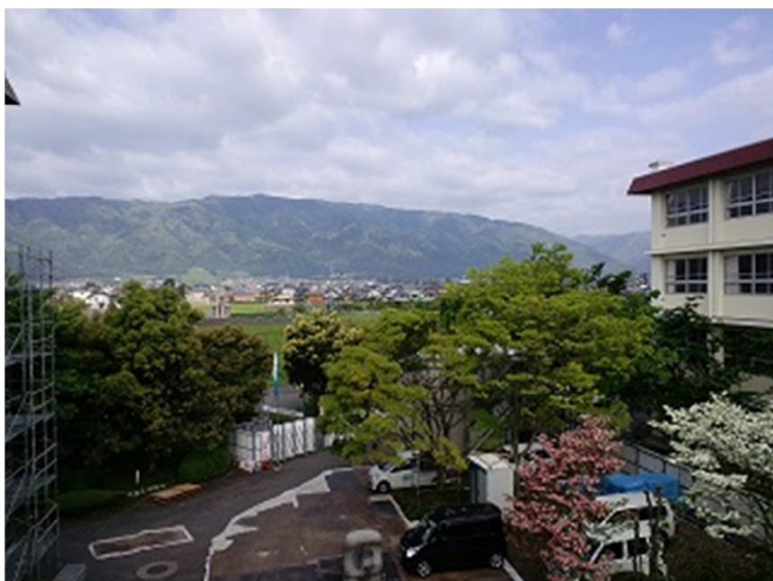
3階の渡り廊下からの池田山の眺め（5月）。