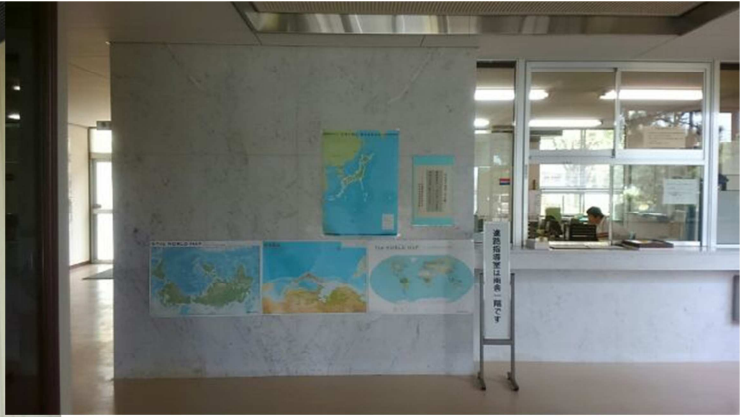
正面玄関を入るとすぐ事務室、外来者受付があります。