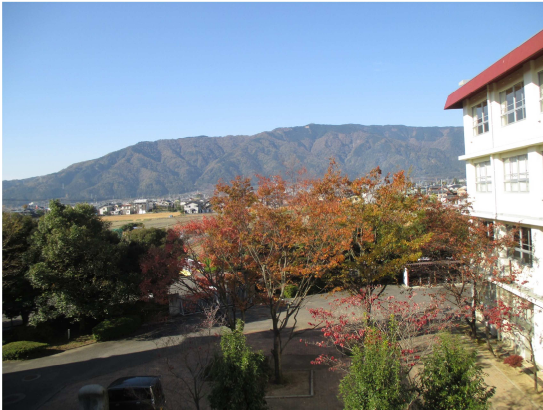
池田高校から西に 池田山を望む。山が色 づき始めています。