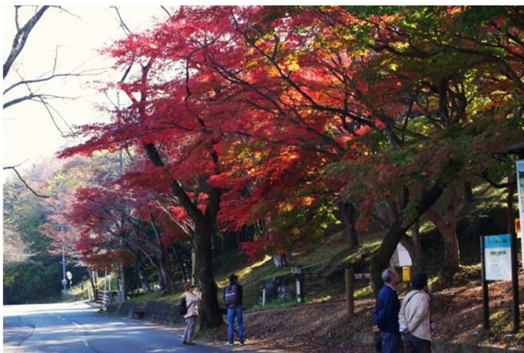
深秋の池田山の紅葉（一般の方がHPに公開している写真より）