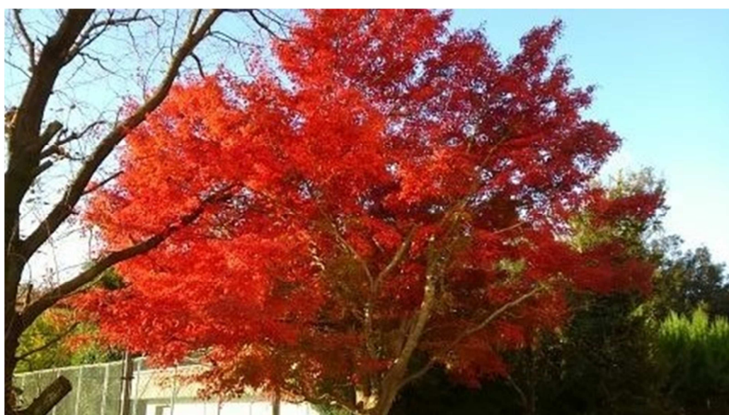
特別棟南側の紅葉。