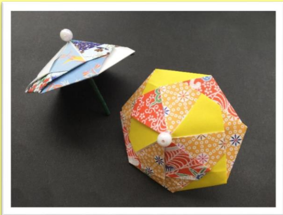
▲工作レクリエーション