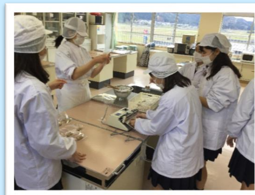
▲作業学習(クッキーの袋詰め)