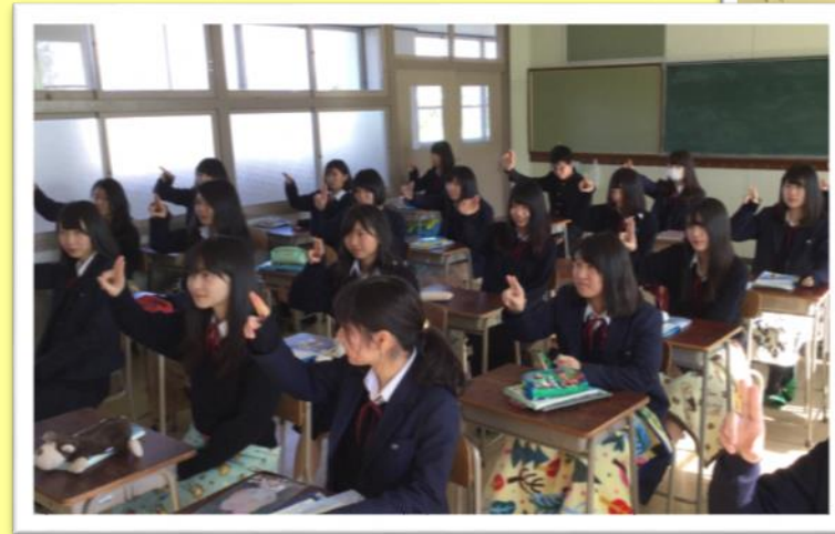
▲手話歌 (365日の紙飛行機)