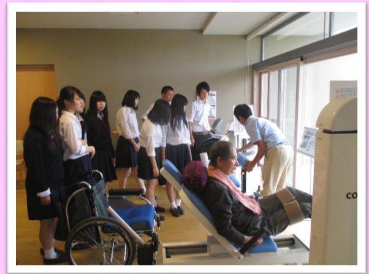
▲リハビリテーション白鳥を見学