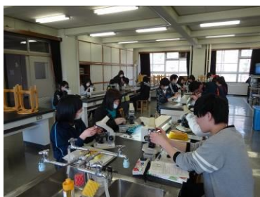
理科の観察実験風景