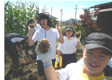
ジャガイモ掘り体験

地域の方々と手を取り合い、地域の中で育ち、地域の中で学び、地域に貢献できる自立した社会人を目指します。また、県下で唯一、小学校と隣接した特別支援学校として、交流を深めながらともに学んでいきます。