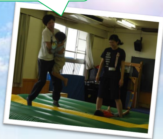
エアトランポリン