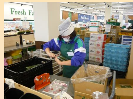
現場実習 (スーパーマーケット)