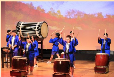
岐阜県特別支援学校音楽発表会 (郡上清流太鼓)