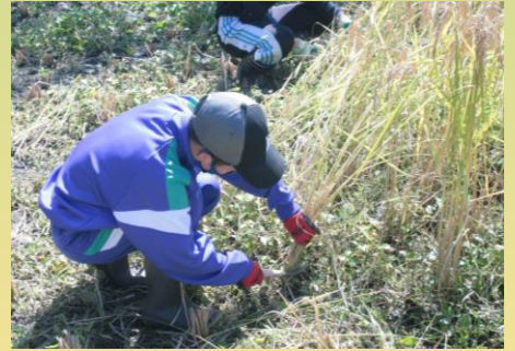
総合的な学習の時間 (稲刈り)