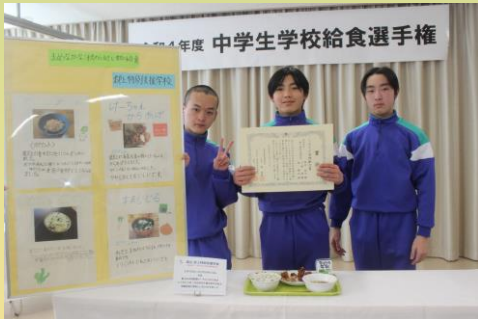
生活単元学習 (中学生学校給食選手権)