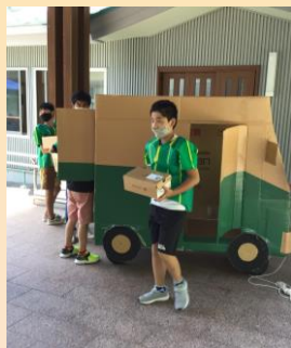
生活単元学習 (配達員になろう)