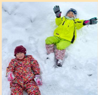
生活単元学習 (雪遊び)