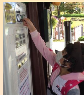
校外学習 (牧歌の里)