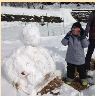
生活単元学習 （雪遊び）