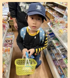
校外学習 （美濃市内）