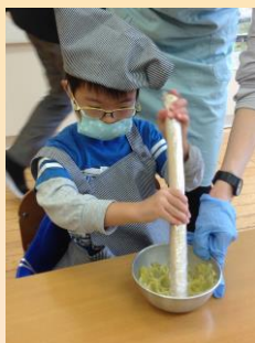
生活単元学習 （調理実習）