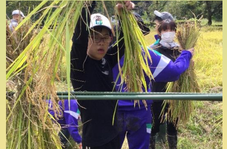
総合的な学習の時間 (稲刈り)