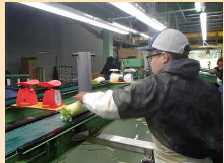
現場実習 (JAめぐみの)