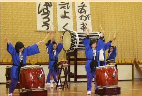
学校祭 (郡上清流太鼓)