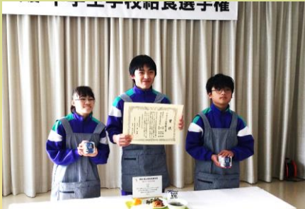
生活単元学習 (中学生学校給食選手権)