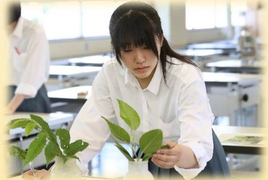
昨年の校内大会の様子