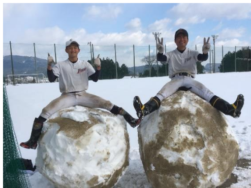
← 野球部員 With 大雪玉