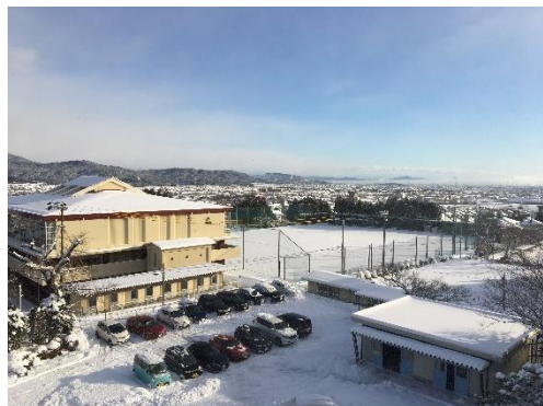
← 校舎4階 からの 風景

先週は連日雪が降り、不破高校は白銀の世界でなかなか気温も上がらず、いまだに雪が残っています。土日もグラウンドに雪が残る中、雪上ノックやトレーニングに励む野球部の姿がありました。トレーニングの一環としての“大雪玉作り”では全身の力を使い、楽しみながら鍛えていました。春の大会や夏の大会に向け雪の日も全力で声を出し、全力で部活動を楽しんでいます。どの部活動も不破高校を盛り上げるために頑張っています。いい結果が出ることを期待しています。燃えろ、不破魂!!!